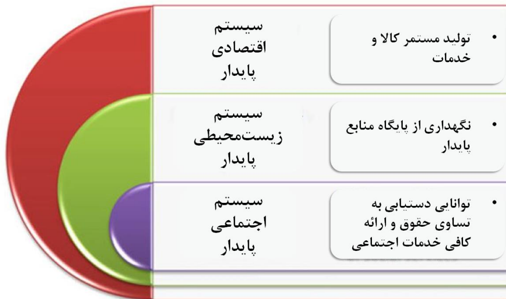
شکل ۱: شبکه پایداری

صنعت نساجی یکی از صنایع پایه‌ای است که یکی از نیازهای اساسی بشر را پاسخ می‌دهد و به جزئی جدایی‌ناپذیر از زندگی انسان تبدیل شده است. در این سری از مقالات قصد بر آن است تا جزئیات وجوه مختلف مفهوم پایداری را اعم از پایداری زیست‌محیطی، اجتماعی و اقتصادی در صنعت نساجی مورد بررسی قرار دهد. این مقالات با معرفی وجوه و جنبه‌های مختلف پایداری، حول مفاهیم آن در بخش نساجی و پوشاک شروع می‌شود. اثرات زیست‌محیطی نساجی و پوشاک بسیار مهم بوده و ساعت‌ها زمان لازم است تا درباره آن گفت‌وگو شود، ولی زمانی که مسئله پایداری در صنعت نساجی مطرح می‌شود، در بسیاری از منابع و مراجع، ذکر شده است که جنبه‌های اقتصادی و اجتماعی آن تحت‌الشعاع اثرات زیست‌محیطی قرار گرفته‌اند. دو عنصر دیگر پایداری نیز به اندازه‌ای یکسانی حائز اهمیت هستند و زمانی که مسئله پایداری در نساجی مطرح می‌شود، این دو موضوع معنا پیدا می‌کنند. این موضوعات کمتر شناخته شده به تفصیل مورد بحث قرار می‌گیرند تا به پایداری در دانش نساجی کمک بیشتری کنند.